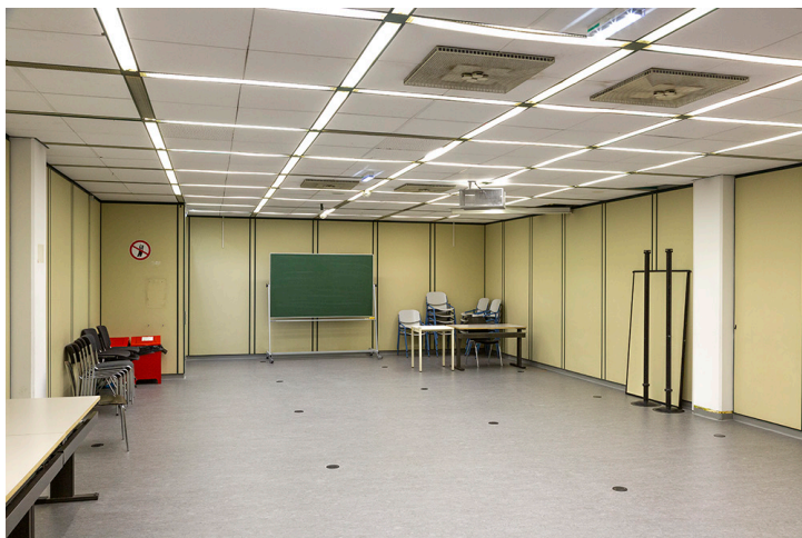
großer Seminarraum - Tafel, Pinnwand