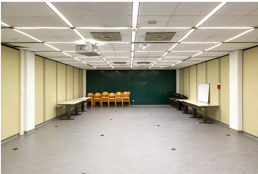
Blick vom Eingang, Tische Stühle, Whiteboard

Der Raum hat kein Tageslicht, jedoch ist durch die großzügige Deckenbeleuchtung ein angenehmes Arbeitssetting gegeben. Eine Aufhängung für einen Beamer ist vorhanden.