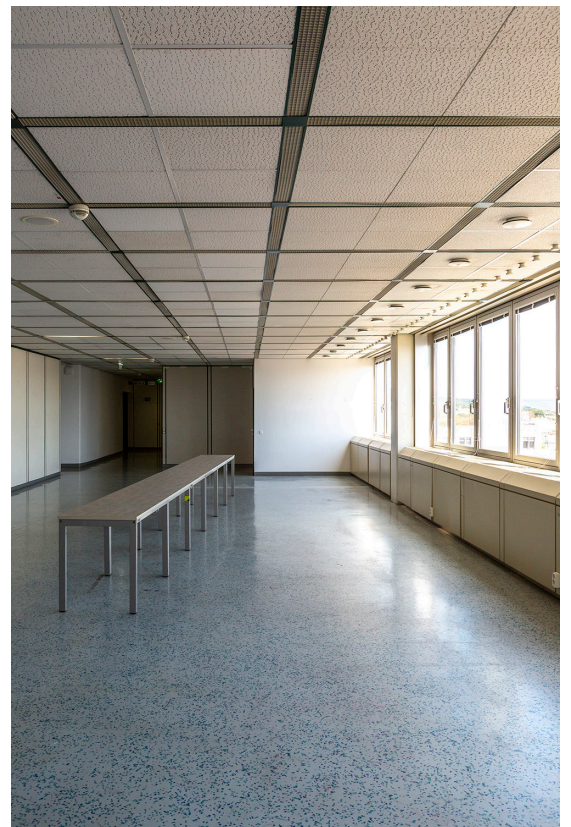
Foyerbereich - Fensterfront mit Weitblick